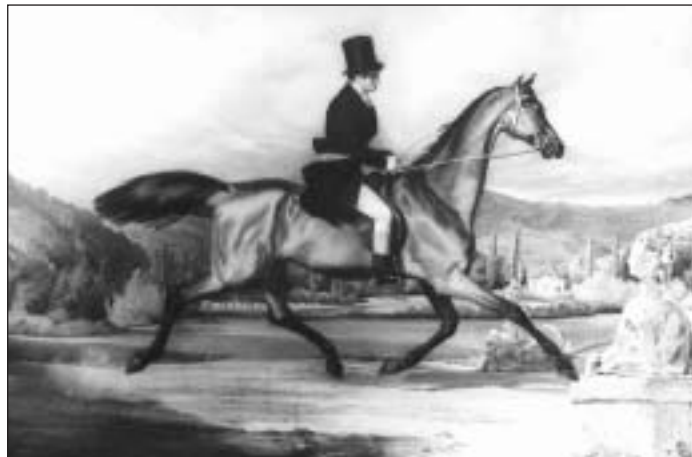
Dobový pohľad na kaštieľ Andrássyovcov vo Vlachove v pozadí za jazdcom na koni.

Ak si, hoci aj zdanlivo drobné a nepodstatné informácie poskladáme ako jednotlivé ohnivé refazy, aspoň v malej miere nazrieme do života Andrássyovcov v 18., ale najmä v 19. stor.