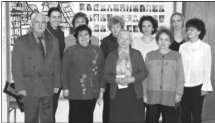
Účastníčky súťaže „Za krajšiu obec 2004“ so starostom pri preberaní cien.