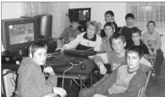
O počítačovú učebňu majú záujem najmä naši školáci.