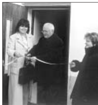
Slávnostné otvorenie lekárskej ambulancie dňa 10.12.2004

Utorok: 7.30 - 12.00 Piatok: 11.00 - 15.00