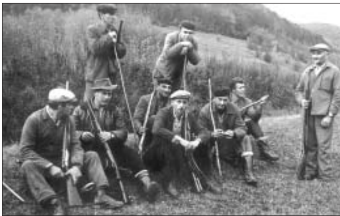
Spoločná poľovačka v roku 1965.