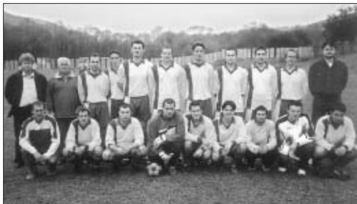
A - mužstvo s realizačným tímom po jeseni 2004.