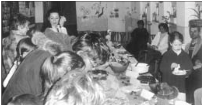
Výstava zdravých jedál v ZŠ sa tešila veľkému záujmu detí aj rodičov.