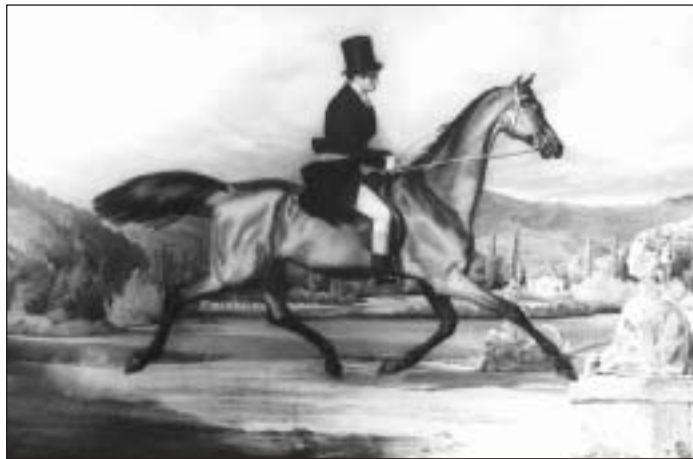
Dobový pohľad na kaštieľ Andrássyovcov vo Vlachove v pozadí za jazdcom na koni.

Ak si, hoci aj zdanlivo drobné a nepodstatné informácie poskladáme ako jednotlivé ohnivé refazy, aspoň v malej miere nazrieme do života Andrássyovcov v 18., ale najmä v 19. stor.