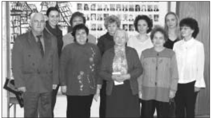
Účastníčky súťaže „Za krajšiu obec 2004“ so starostom pri preberaní cien.