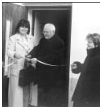
Slávnostné otvorenie lekárskej ambulancie dňa 10.12.2004

Utorok: 7.30 - 12.00 Piatok: 11.00 - 15.00