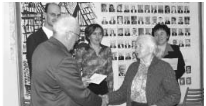
Najstaršou občiankou z ocenených za kvetinovú výzdobu v roku 2004 bola E. Vandráková. (K článku na 2. str.)