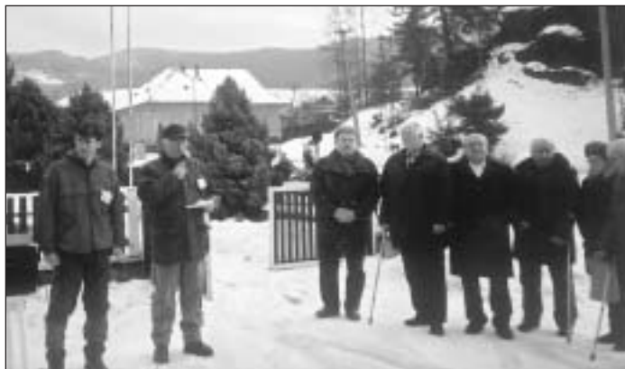
Štartu zimného výstupu na Stromiš sa zúčastňujú aj najstarší členovia SZPB vo Vlachove.