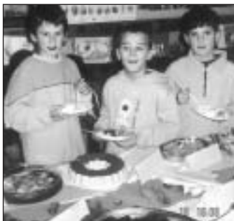
Zdravé jedlá chlapcom mimoriadne chutili.