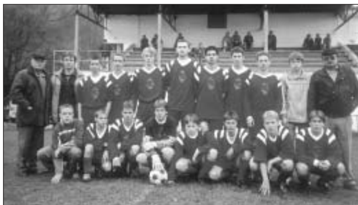
Dorastenci v plnej zostave sa chystajú na jar 2005.