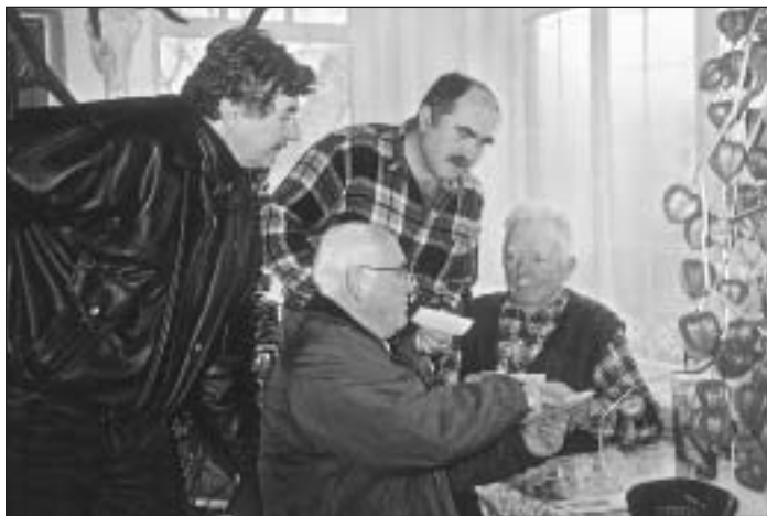
U Černajovcov zaujali komisiu písomné a fotografické dokumenty z histórie obce, ako aj pracovné predmety žien a furmanov.