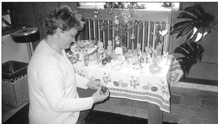
Učiteľky materskej školy pripravili v interiéri obecného úradu k voľbám prezidenta peknú výstavku škôlkarov s tematikou Veľkej noci.