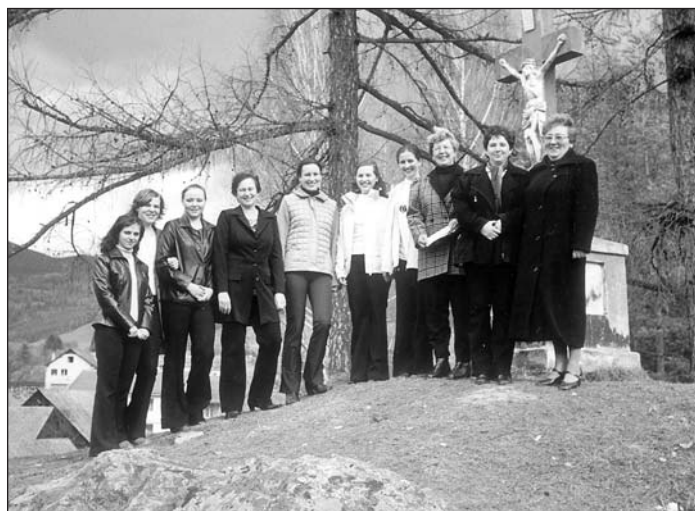
Ženská spevácka skupina FS Stromiš pri križi na Jozefa.