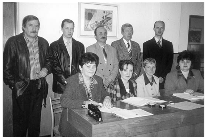
Volebná komisia si svoju činnosť pri voľbe prezidenta SR zopakuje.