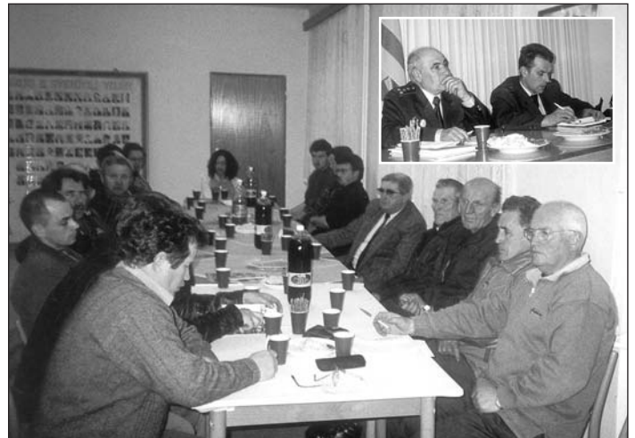
Účastníci výročnej schôdze vlachovských hasičov.