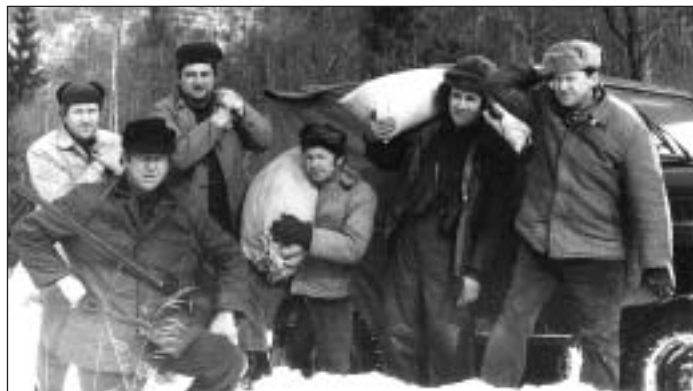
Členovia PZ prikrmujú zver v Riešici, r. 1987.

to smerom na Žliabky nad Gočovom. Po zotmení sa vracal domov okolo Odkaliska na Banské. Počul, že v hrabovom lese niečo šuchoce a mľaská. Zastal za šípkovým krikom, asi 20 metrov od lesa a čakal. Po chvíli z lesa vyšlo čosi veľké, tmavé a guľaté. Zobral veľký pozorovací ďalekohľad a sledoval zvera. Keďže už bola tma, nevedel ho rozoznať, no pozdávalo sa mu to na veľkého diviaka. Zver prišiel k nemu asi na 15 krokov a vtedy naň posvietil baterkou. Aké to bolo prekvapenie, keď sa pred neho postavil medveď. No hovorí, že sa nezľakol. Medveď sa v okamihu otočil a upaľoval do lesa, kde