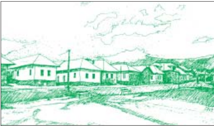
Obec Vlachovo si zachováva tradície, rozvíja zamestnanosť i agroturistiku. Pohľad na pôvodnú „potočnú“ zástavbu. Autorka kresby: S. Honětzová