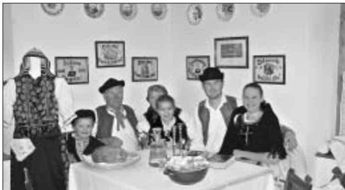
Na otvorení obecného múzea tvorili rodinku členovia folklórneho súboru Stromiš.