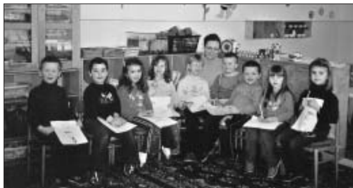
Deti MŠ na hodine angličtiny.