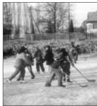
Na rybníku.

O Vlachove sa dá hovoriť veľa. Ani vo vysielaní rádia Regina nebolo odovyslané to všetko o čom hovorili obyvatelia Vlachova, čo je škoda. Ale o nás už vie celé Slovensko a pomaly to bude aj Európa. Len ma veľmi mrzí (a nielen mňa), že hlavne mladí ľudia (a sú to hlavne tí, ktorí nepriložili ruku k dielu) nám ničia a špatia, čo im pride "pod ruku": rozbité okienko na autobusovej zastávke, vylámané a pokrivené ploty, porozhadzované kvetináče pod altánkom v šetiari, atď., Neštítia sa zahodiť na ulici fľašu, poháre, obaly z cigariet a sladkostí. Hanbím sa pred návštevami, keď vidia pohodené igelitky, rôzne sklá a celkový neporiadok spôsobený nesprávnymi a neporiadnikmi. Konečne by si mali tieto