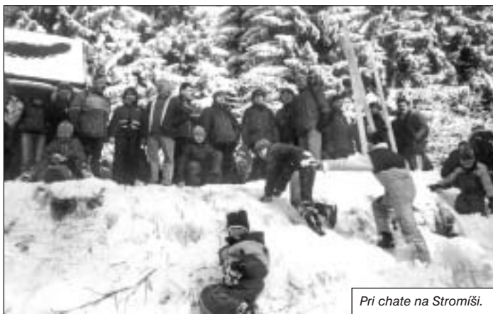
Pri chate na Stromiši.

24.9. sme urobili najkrásjšiu, ale zároveň najdlhšiu túru vo Vysokých Tatrách, ktorá nám trvala až jedenásť hodín. Ráno o 6.00 hod.