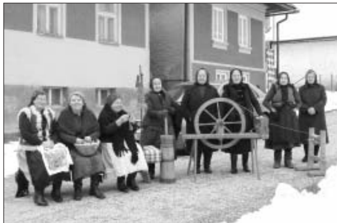
Ženičky v kroji zaujali v Dedine roka všetkých hostí ...