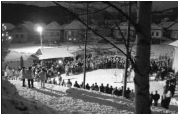
Pohľad na gubajku 2005 zo „Skauky“.