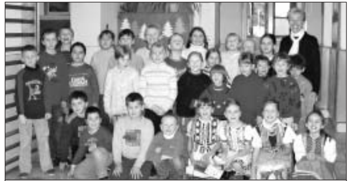
Žiaci ZŠ vzorne prezentovali školu pred delegáciou Dediny roka 2005.