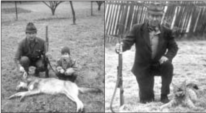
Marcišovci so streleným vlkom (1999) a rysom (1990).