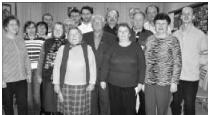
Ocenení občania v súťaži „Za krajsiu obec 2005“ s komisiou.

28. zasadnutie OCZ vo Vlachove sa konalo 14. decembra 2005.