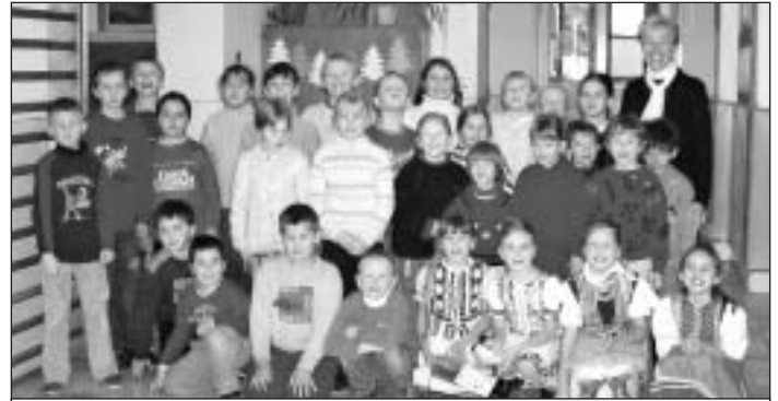
Žiaci ZŠ vzorne prezentovali školu pred delegáciou Dediny roka 2005.