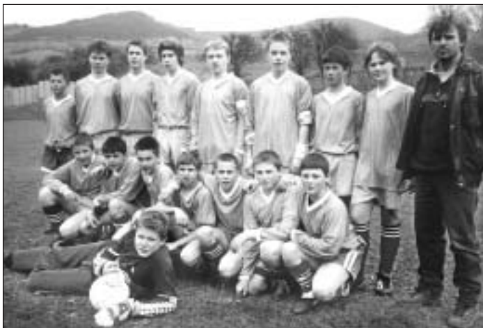
Mužstvo žiakov na začiatku súťaže 2005/2006.