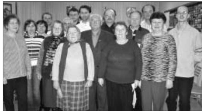
Ocenení občania v súťaži „Za krajšiu obec 2005“ s komisiou.

28. zasadnutie OCZ vo Vlachove sa konalo 14. decembra 2005.