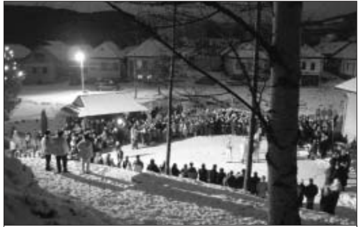
Pohľad na gubajku 2005 zo „Skauky“.