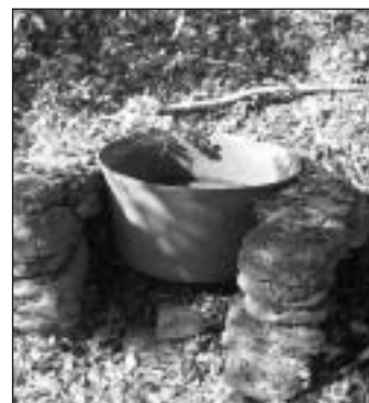
Donedávna bol pri ľadovni tento liatinový kotol. Už tam nie je. Komu asi chýbal?