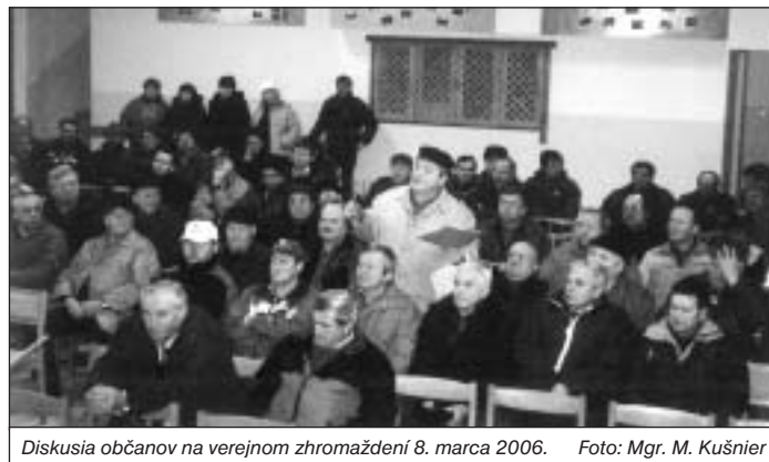
Diskusia občanov na verejnom zhromaždení 8. marca 2006.