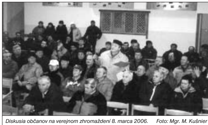
Diskusia občanov na verejnom zhromaždení 8. marca 2006.