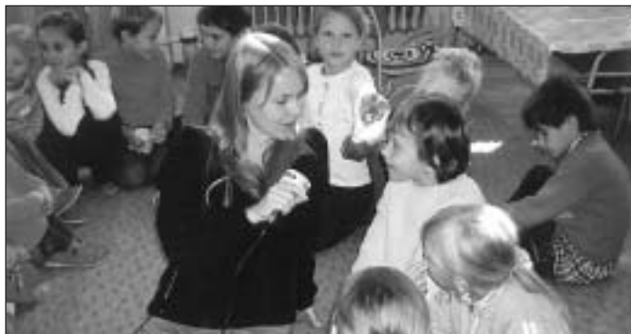
Žiaci ZŠ v rozhovore s redaktorkou rádia Regina Košice.