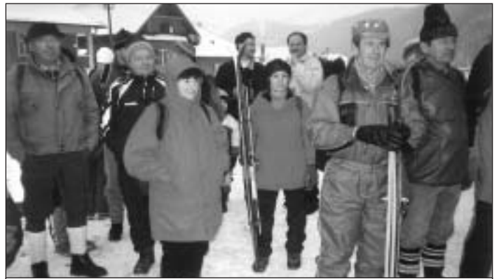
Účastníci 29. ročníka výstupu na Stromiáš pred OcÚ.

Po zostupe zo Stromiša sa turisti zišli v zrenovanom kultúrnom dome, bývalom kaštieli rodiny Andrassyovcov, kde bol podávaný guláš a občerstvenie. Do