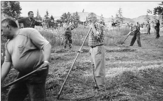
Trávnaté plochy cintorína je treba kosiť trikrát ročne. Pomoc občanov je vždy vítaná