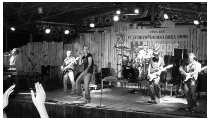
NO NAME vo Vlachovskom amfiteátri