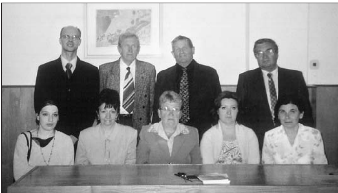
Okrsková volebná komisia v parlamentných voľbách 2006

Zastupiteľstvo sa zaoberalo VZN obce Vlachovo o poskytovanie dotácií a návratných finančných výpomocí, správou o hospodárení VPS za rok 2005 a prípravou na letnú turistickú sezónu 2006, žiadosťou ZŠ s MŠ o finančný príspevok, prípravou obce na hodnotenie o "Európsku cenu obnovy dediny 2006" európskou komisiou ARGE v dňoch 16.-17. 6. 2006, návrhom programu Vlachovské kultúrne leto 2006, správou o podporených a zamietnutých žiadostiach o finančné prostriedky z mimorozpočtových zdrojov, riešilo sťažnosti a žiadosti občanov. Starostom obce bola vyhlásená súťaž "Za krajšiu obec 2006".