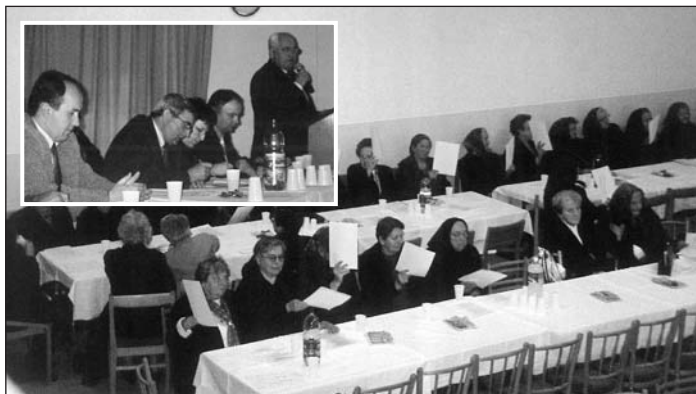
Pohľad na účastníkov VČS PD vo Vlachove