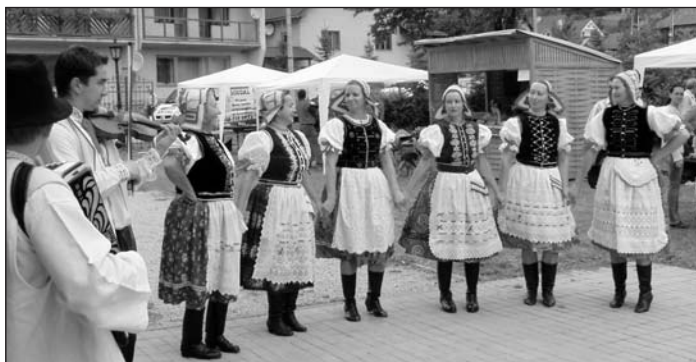
Ženská spevácka skupina FS Stromiš pri vystúpení na Vlachovskom jarmoku

Na jarmoku vystavovalo a predávalo svoje výrobky z kovu, kože, dreva, kameňa, textilu a iného prírodného materiálu 21 výrobcov z Vlachova, Dobšinej, Rejdovej,