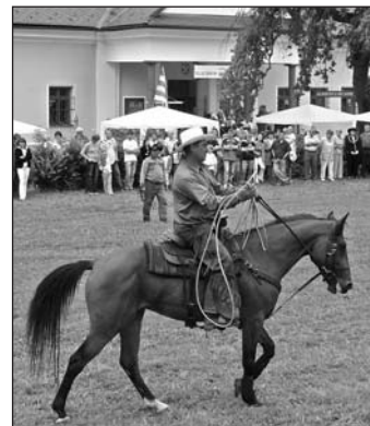
Rodeo na vlachovskom jarmoku