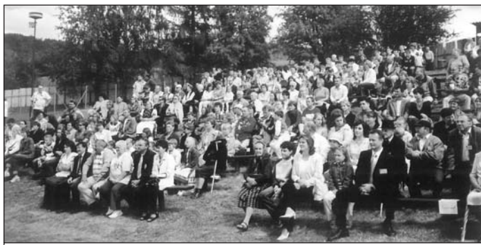
Diváci na folklórnom festivale 2006