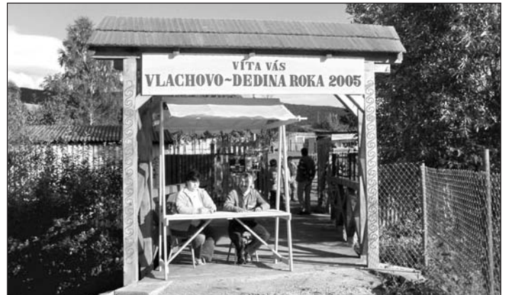
Novú malú stavbu - Mostík cez potok Riečica postavili pri armiteátri pracovníci firmy GALL a zamestnanci v rámci aktivačnej činnosti.