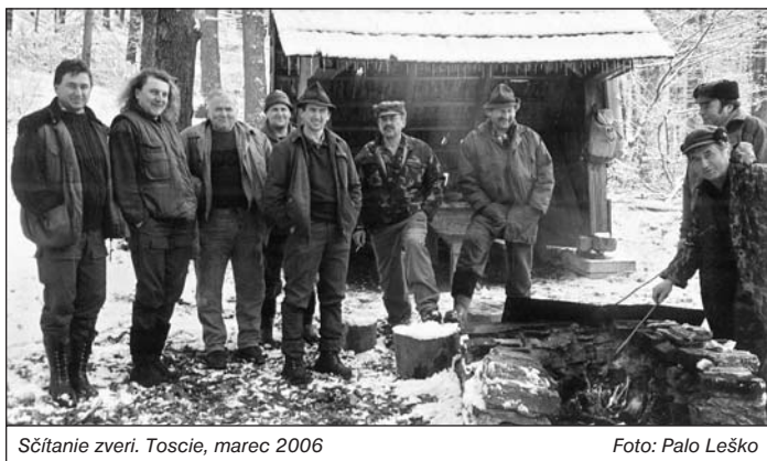
Sčítanie zveri. Toscie, marec 2006

V roku 2003 sme zaznamenali v našom revíri veľký úbytok úžitkovej zveri. Zníženie stavov zveri sme pozorovali už od roku 1998, ako následok rozšírenia pytlíctva a zvyšovania stavov dravej zveri, najmä vlka, rysa a medveďa. Aj z toho dôvodu bolo pomerne ťažké v uvedenom ro-