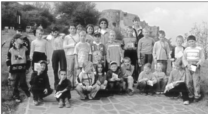
Naši žiaci na hrade Devín