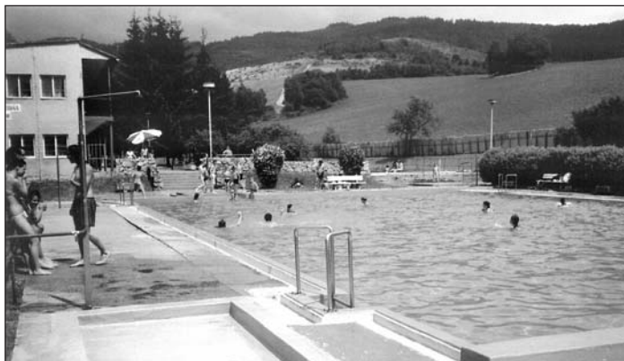
Vlachovské kúpalisko v júli 2006