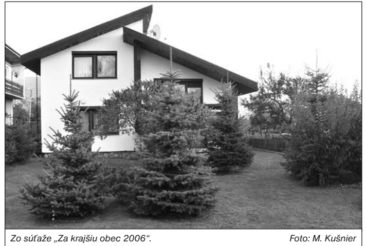
Zo súťaže „Za krajšiu obec 2006“.