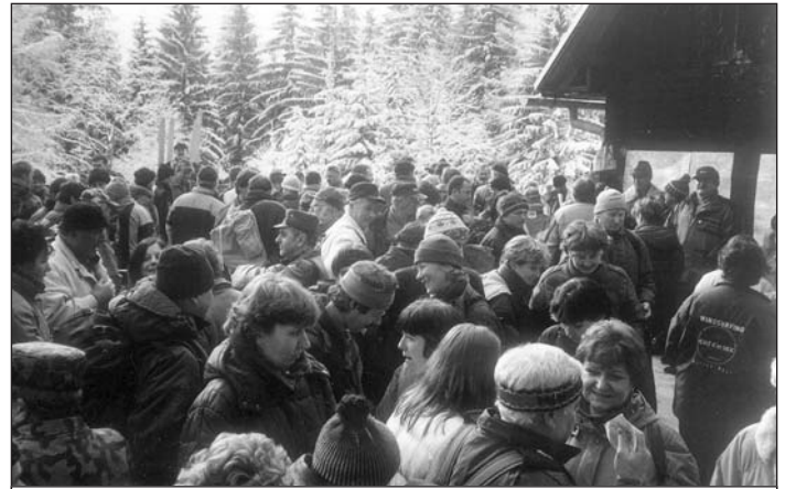
Na Stromiši pri chate v januári 2006.