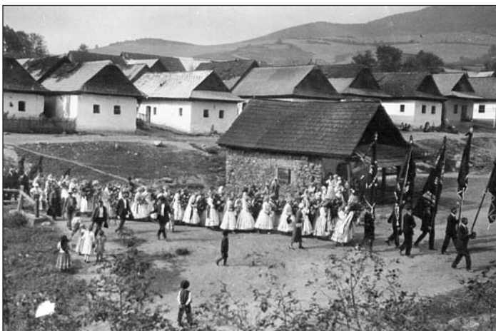
Čelo pohrebného sprievodu Vojtecha Vrablicu pred cintorínom pri bývalej „šmitni“.