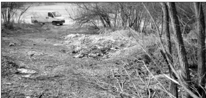
Do lesa Pod Michlovom neustále ktosi vozi domový a stavebný odpad. Je to trestné a obec stojí likvidovanie čiernej skládky veľa síl a peňazí. Zabráňme tomu!