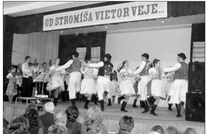
Dňa 1. decembra 2007 oslávil Folklórny súbor Stromiš 40. výročie svojho vzniku. Reportáž o tomto jubileu prinesieme v ďalšom čísle našich novín.

Ďalšie priestory MŠ dostala mládež na Klub mladých. Svojopomocne si klub vymaľujú a za pomoci obce aj zariadenia nábytkom. Pripravený majú výbor klubu, zostávajú štatút a organizačný poriadok s otváracími hodinami a podmienkami prevádzky klubu.