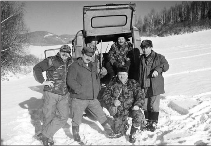
Vlachovskí poľovníci v zimnej prírode Nad kofajou počas spoločnej poľovačky v decembri 2005.