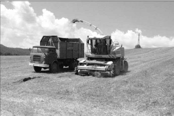
Naši družstevníci pri zbere zeleného krmiva v Doline.