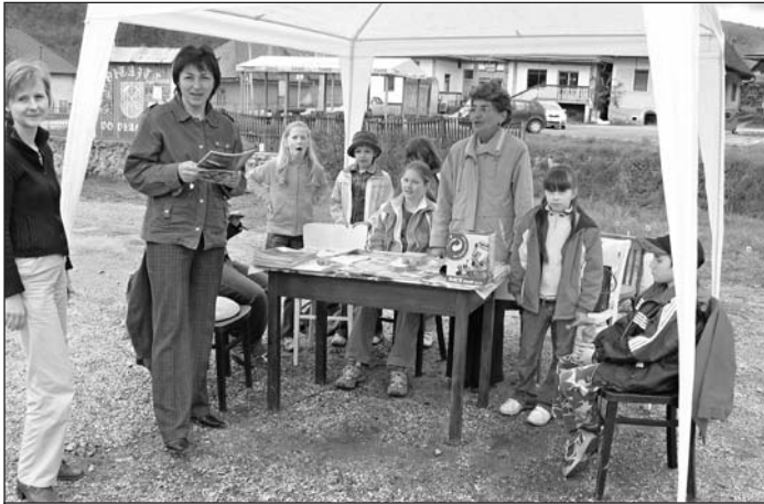
Stánok detí a ochrancov prírody na dolnom námestí vo Vlachove.