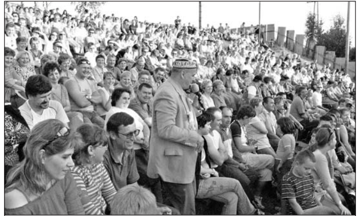
Prvým podujatím tohtoročného Vlachovského kultúrneho leta bolo vystúpenie skupiny Driš'ak, ktorá pobavila zaplnené hľadisko amfiteátra.

Hlavné podnikateľské zámery v roku 2008 družstvo zameralo na vypracovanie projektov v novom plánovacom období