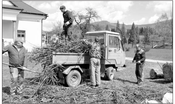
Pracovníci obce pri zveľaďovaní životného prostredia.