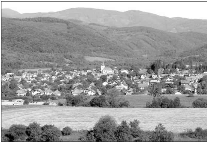
Pohľad na Vlachovo z juhu od Gočova.