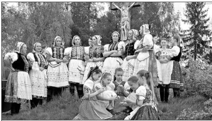
Záber z pripravovaného filmu o histórii a súčasnosti obce - Jozefovské spevy.