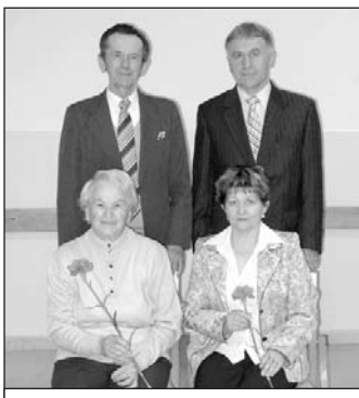
Riaditeľské rodiny našej školy (jkč)

Riaditeľka ZŠ poďakovala účastníkom podujatia, že prijali pozvanie organizátorov a ocenila všetkých bývalých riaditeľov, učiteľov a ostatných zamestnancov vlachovskej školy za zveľadovanie nielen jej priestorov, ale aj ľudských duší.