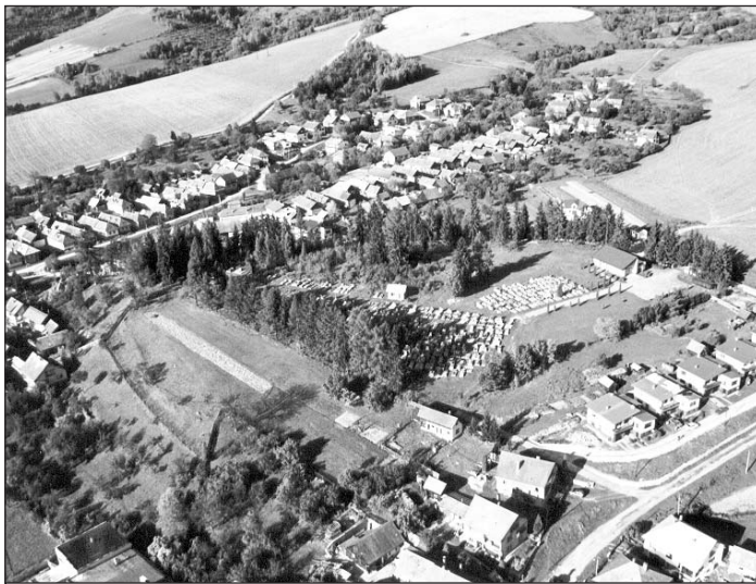
Pohľad na centrálnu časť obce Vlachovo s miestnym cintorínom.