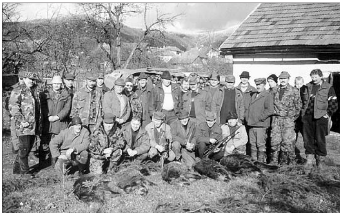
Vlachovsko-gočovskí poľovníci s úlovkami diviakov.