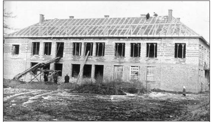
Historický záber z výstavby budovy Základnej školy vo Vlachove.