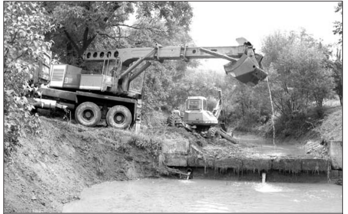
Pracovníci Povodia Slanej pri čistení Vlachovského potoka v auguste t.r.