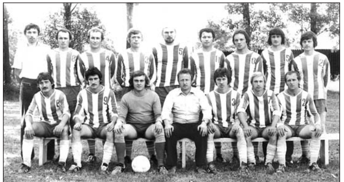
Mužstvo FK Vlachovo, ktoré vyskúšalo ligové trávniky. Poznali by ste ich dnes?