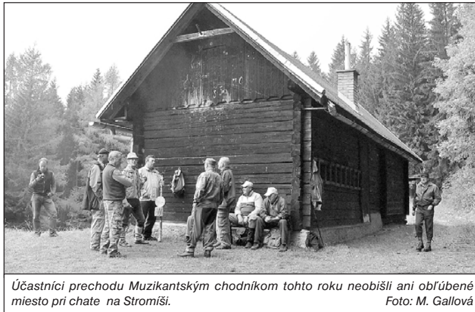
Účastníci prechodu Muzikantským chodníkom tohto roku neobišli ani obľúbené miesto pri chate na Stromiši.