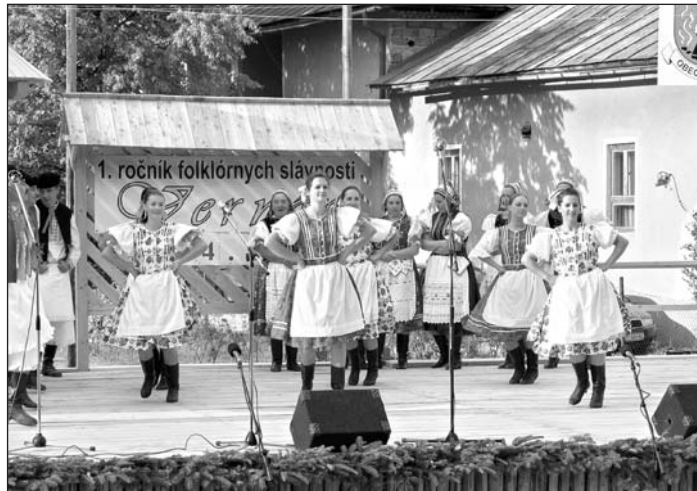
Folklórny súbor Stromiš na prvom ročníku FS vo Vernári.