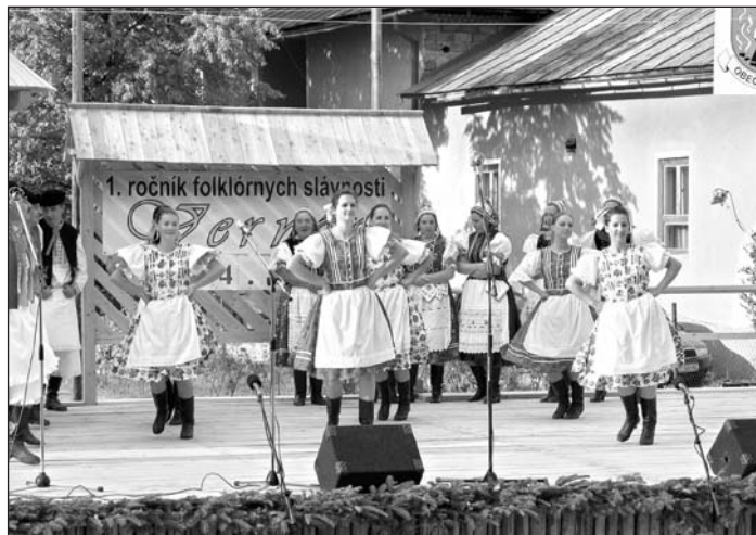
Folklórny súbor Stromiš na prvom ročníku FS vo Vernári.