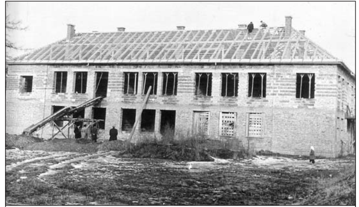
Historický záber z výstavby budovy Základnej školy vo Vlachove.