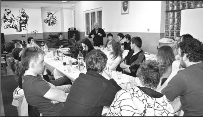
Výročná schôdza OZ Stromiáš riešila prevažne činnosť FS Stromiáš.