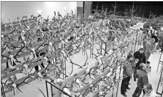
Výstava poľovníckych trofejí vo Vlachove.

Poľovnícka prehliadka bola pripravená na vysokej odbornej a organizačnej úrovni