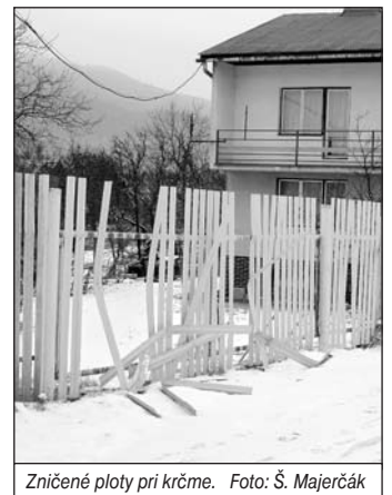
Zničené ploty pri krčme.

mjr. Mgr. Milan Petrigáč riaditeľ obvodného oddelenia PZ