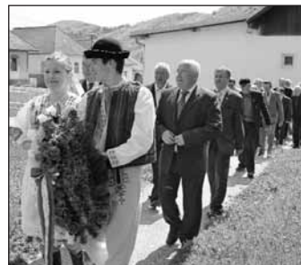
Matičiari vzdali hold osloboditeľom od fašizmu položením venca k pamätníku padlých