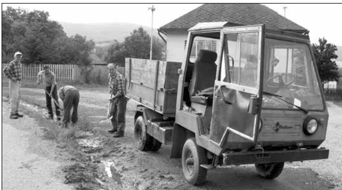
Čistenie a údržba rigolov je v obci vykonávaná každú jar a jeseň

Uznesením Valného zhromaždenia Pozemkového spoločenstva Vlachovo boli schválené ceny dreva pre samovýrub členov na 3,5 Eur/pm palivové drevo do 10 pm na