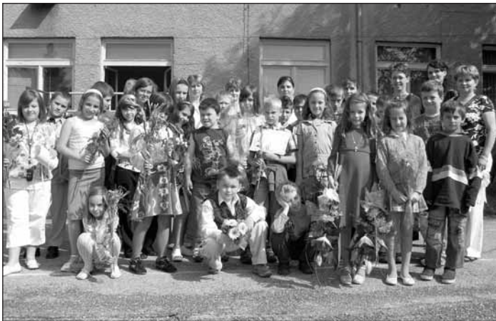
Deti a kvety sú symbolikou septembra