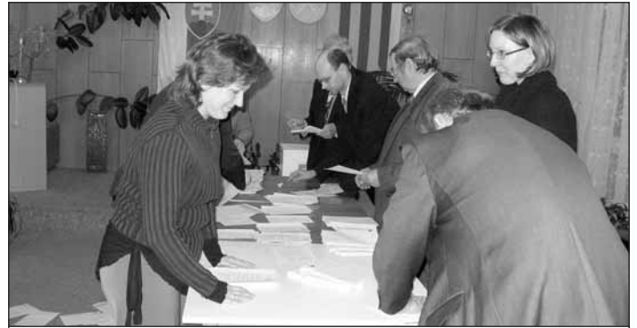
Dôležitú úlohu - sčítanie hlasov voličov vykonáva okrsková volebná komisia po uzatvorení volebnej miestnosti