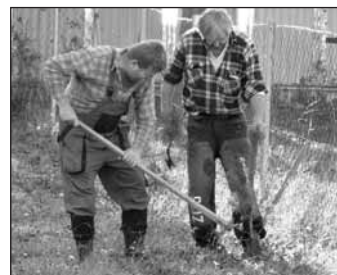
Pracovníci obce pri výsadbe 100 ks borovic na jar 2009

Pravda je taká, že družstevné podielnícké listy, ktoré vydalo naše družstvo z vypočítaných majetkových podielov, naše družstvo ako právnická osoba aj skupilo a nie členovia predstavenstva, nebudaj súkromné osoby manažmentu a už vôbec to nemá nič spoločné s vlastníctvom pozemkov, ktoré družstvo má len na základe nájomných zmlúv v užívaní.