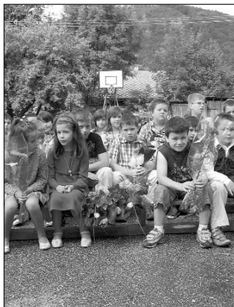
Aký bude nový školský rok?

Výhodou detí v našej obci je, že sa rodiny navzájom poznajú a že deti svoje poznatky získané v materskej škole môžu ďalej rozširovať v domácom prostredí. Vlachovské deti sú mimoriadne citlivé, kamarátske, sebavedomé, ctíživé a vyžadujúce si stálu pozornosť. A práve v tom sú milé a jedinečné.