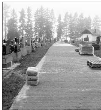
Pietne miesto vlachovského cintorína je obohatené o vydláždený chodník