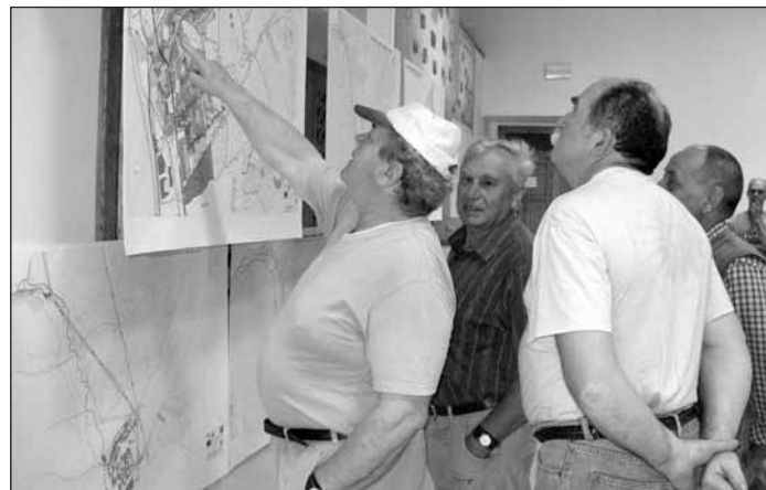
Občania Vlachova pri posudzovaní návrhu Územného plánu

V správe o výsledkoch školského roka 2008/2009 informovala riaditeľka ZŠ s MŠ o priaznivých vyučovacích výsledkoch ško- ly, ale aj o problémoch s prevádzkou tak- mer 50-ročnej budovy ZŠ. Osvedčilo sa sústredenie ZŠ a MŠ do hlavnej školskej budovy a spokojnosť je aj s riešením stravo- vania detí dovozom stravy zo ŠJ ZŠ Nižná Slaná. V budúcom roku 2009/2010 dôjde k poklesu počtu žiakov na 28 a v MŠ na 13 detí. Poslanci a aktivisti vyjadrili pedagogic-