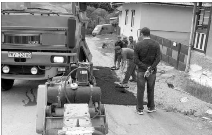
Rekonštrukcia cesty na Mlynskej ulici pracovníkmi VVS, a.s. Košice