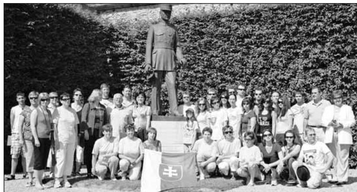
Delegácia FS Stromiš a Matices slovenskej pri soche M. R. Štefánika v Paríži